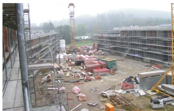
Blick auf Innenhof (Rohbau fertig gestellt)