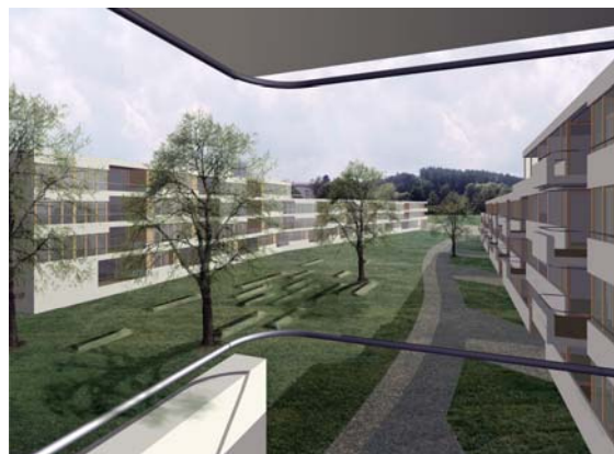
Rendering Blick von Balkon auf beide Häuser