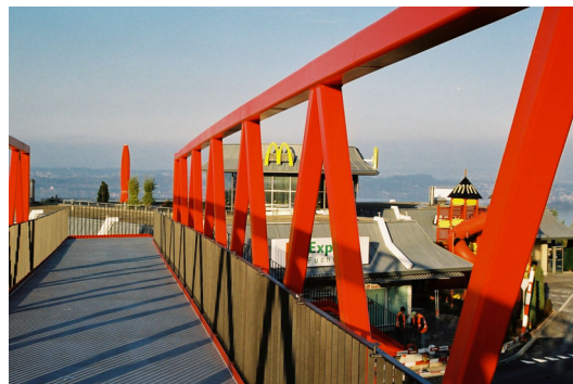
Aussicht Richtung Zürichsee ( Seite Raststätte Nord)