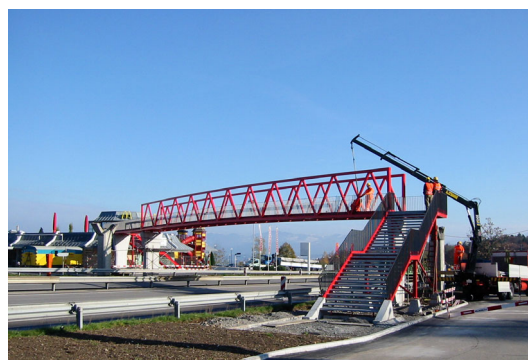
Endmontage der Brücke, kurz vor Inbetriebnahme