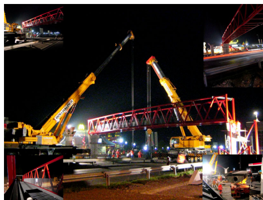
Montage des Brückenkörpers