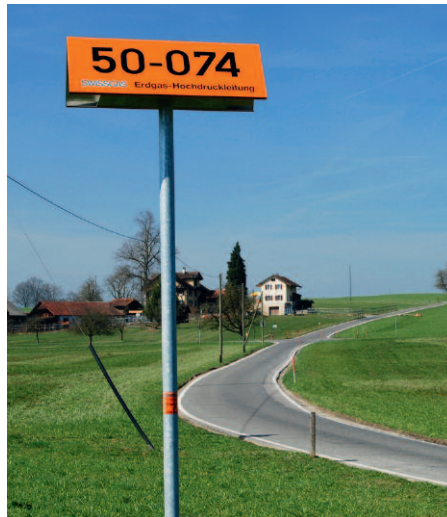
Gasleitung am Littauerberg; ein Beispiel einer Gefährdung, die weniger im Bewusstsein von Bevölkerung und Verwaltung ist.

Doch das Urteil von Fachleuten und das Verwenden objektiver Kriterien reichen allein nicht aus, um zu erkennen, in welchen Bereichen die Sicherheitsplanungen einer Gemeinde anzupassen sind. Wenn beispielsweise eine Parkanlage oder ein öffentlicher Platz abends oder nachts als unsicher empfunden wird, dann gilt es diese subjektive Einschätzung ernst zu nehmen. Selbst dann, wenn die Kriminalstatistik keine Auffälligkeiten zeigt und städtische Experten ein hohes Sicherheitsniveau bescheinigen. In die Beurteilungen des Luzerner Sicherheitsberichts flossen deshalb