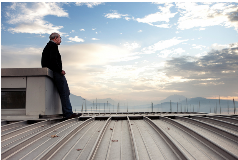
Das Gebäudeprogramm Corporate Image