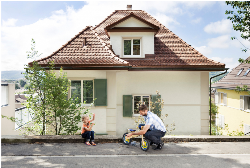
Das Gebäudeprogramm Corporate Image

While the various cantons have been responsible for implementing the Federal Building Program and communicating their funding conditions since the beginning of 2017, EBP continues to manage the national website for the Federal Building Program.