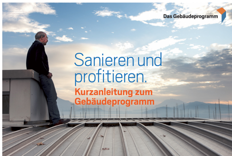
Das Gebäudeprogramm Leporello