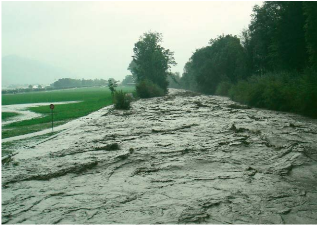
Vorentlastung der Engelberger Aa: beim Unwetter 2005...

Das IT-basierte Tool zur Einschätzung und Vorbeugung von Naturgefahren.