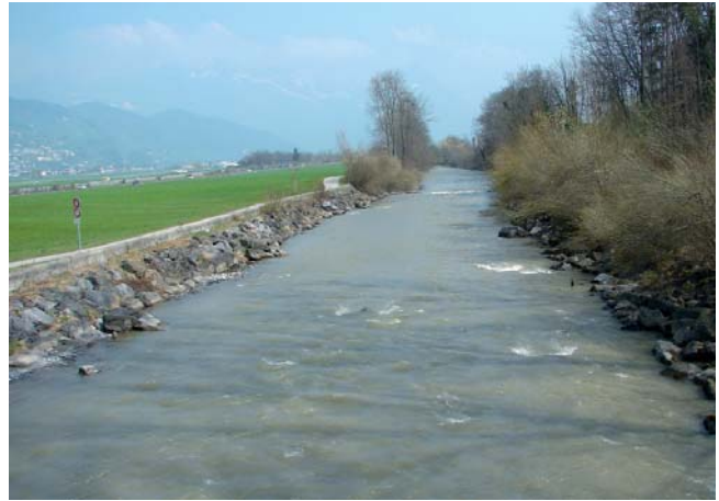
...und bei normalem Sommerwetter.

Was ist auf Dauer kostengünstiger: Ein Tunnel, der das Steinschlagrisiko auf Null reduziert – oder genügt allenfalls eine Frühwarnanlage? Welchen Beitrag können die Hauseigentümer leisten, um im Falle eines Hochwassers mögliche Schäden zu reduzieren – und wirken sich diese Massnahmen auf mögliche Schadenkosten aus? Solche Fragen gilt es beim Schutz vor Naturgefahren immer wieder zu beantworten. Wie einfach es doch wäre, wenn wir über einen Automaten verfügen würden, den wir mit Zahlen füttern könnten, um dann einen Papierausdruck mit der Anleitung zum Handeln zu erhalten.